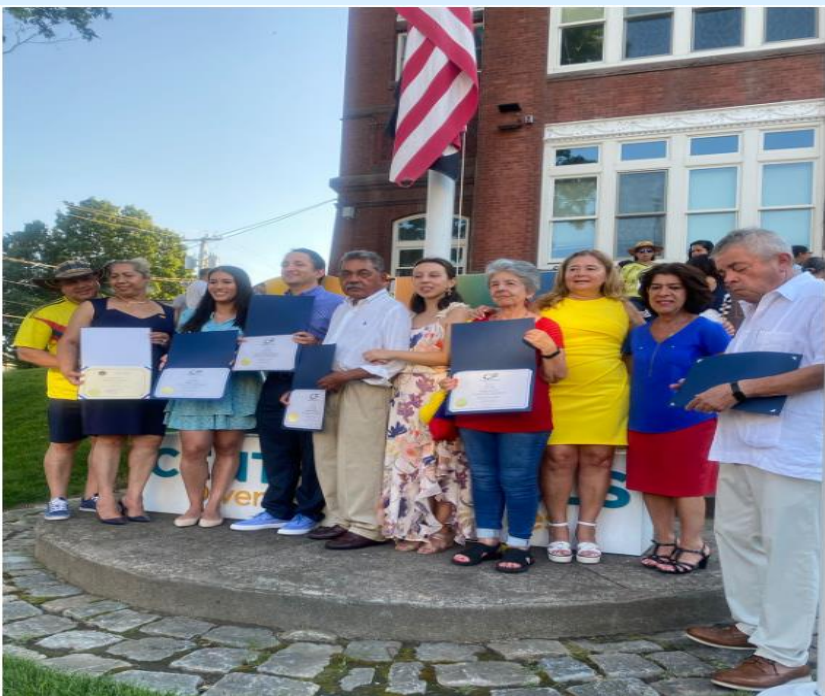
Central Falls, RI.

El Consulado se complació de participar en los 7 eventos organizados por nuestras comunidades de la circunscripción en conmemoración de los 212 años de Independencia de Colombia.